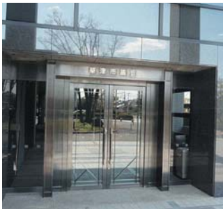
議会棟入口（市役所南玄関横です）

※また、手話通訳を希望する場合は、傍聴希望日の7日前までに、お申込みください。（詳しくは議会事務局までお問い合わせください）