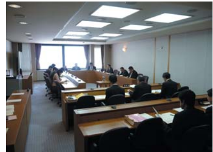
傍聴席から見た委員会室の様子