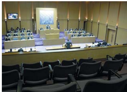
傍聴席から見た本会議場の様子